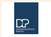
DP Fraktioun Gemeng Réiser

Jede politische Partei verfügt über eine Seite im Gemeindeblatt „De Buet“ pro Gemeinderatssitzung, um ihr Abstimmungsverhalten zu begründen beziehungsweise ihre Standpunkte zu einzelnen Punkten der Tagesordnung zu erklären.