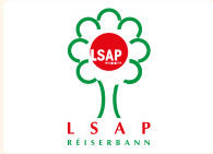
LSAP Fraktioun Gemeng Réiser

Jede politische Partei verfügt über eine Seite im Gemeindeblatt „De Buet“ pro Gemeinderatssitzung, um ihr Abstimmungsverhalten zu begründen beziehungsweise ihre Standpunkte zu einzelnen Punkten der Tagesordnung zu erklären.