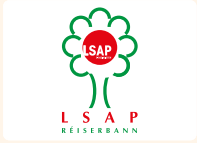
LSAP Fraktioun Gemeng Réiser

Jede politische Partei verfügt über eine Seite im Gemeindeblatt „De Buet“ pro Gemeinderatssitzung, um ihr Abstimmungsverhalten zu begründen beziehungsweise ihre Standpunkte zu einzelnen Punkten der Tagesordnung zu erklären.