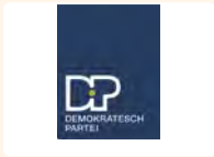
DP Fraktioun Gemeng Réiser

Jede politische Partei verfügt über eine Seite im Gemeindeblatt „De Buet“ pro Gemeinderatssitzung, um ihr Abstimmungsverhalten zu begründen beziehungsweise ihre Standpunkte zu einzelnen Punkten der Tagesordnung zu erklären.